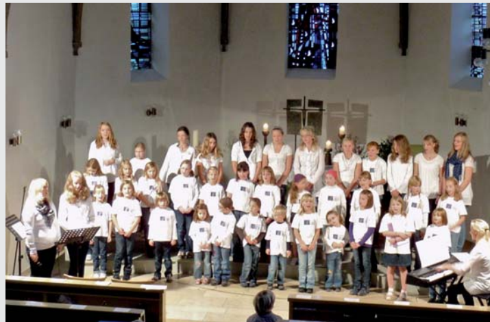
Der Kinder- und Jugendchor Pro Musica entführte die Zuhörer täuschend echt in den Urwald.

Im August dann der zweite Akt: eine musikalische Zeitreise durch fünf Jahrhunderte mit dem Osterwalder Männer- und dem Frauenchor des Bergmusikvereins sowie dem Blockflötenensemble aus Ilten und der Sopra-