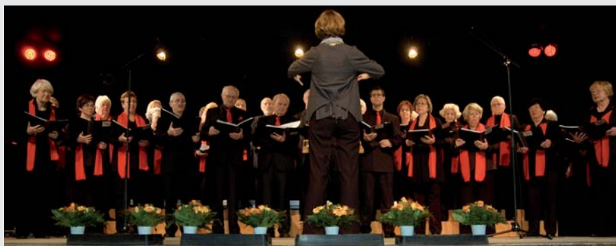
Der Kammerchor Herrenhausen brachte die Aula als erster zum Klingen.