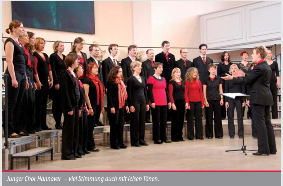
Junger Chor Hannover – viel Stimmung auch mit leisen Tönen.

Zum Auftakt brachte der Chor Canta Nova schwungvolle Stücke in die Weite der Kirche, als wollten sie sagen: „Hört her, es geht jetzt endlich los!“ Anschließend ließ es der Junge Chor Hannover deutlich ruhiger angehen und begann seinen 15-Minuten-Part mit leisen, besinnlichen Klängen. Dies war jedoch nur eine kurze Atempause, bevor die etwa 30 Sänger und Sängerinnen mit aufgeregtem „Weibergega-