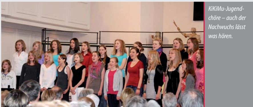
KikiMu-Jugendchöre – auch der Nachwuchs lässt was hören.

Die Mittsommernacht der Chöre ist einer der jährlichen Chorkonzertthöhepunkte in der Stadt Hannover. aj