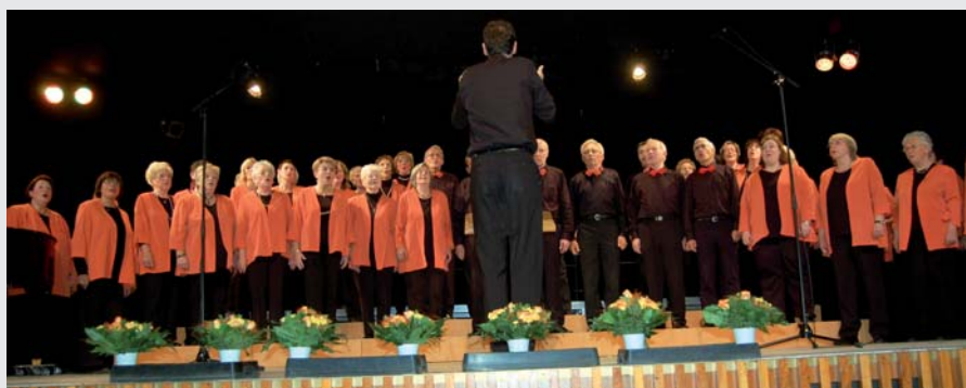
Bot ein breites Musikspektrum: der Gemischte Chor Brink/Langenhagen.