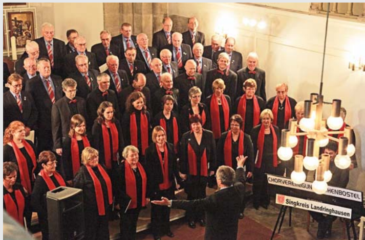
Der Singkreis Landringhausen und die Chorvereinigung Hohenbostel begeisterten die Zuhörer in der Klosterkirche.