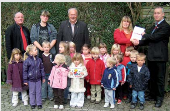
Auch die Kinder und Erzieherinnen des DRK-Kindergartens in Neuhof/Harz sind stolz auf die FELIX-Auszeichnung.

Die Kinder und Kindergartenleiterinnen sowie Erzieherinnen freuten sich riesig über die offizielle Überreichung der Auszeichnung, der auch die Ortsbürgermeister und die örtliche Presse beiwohnten. fd