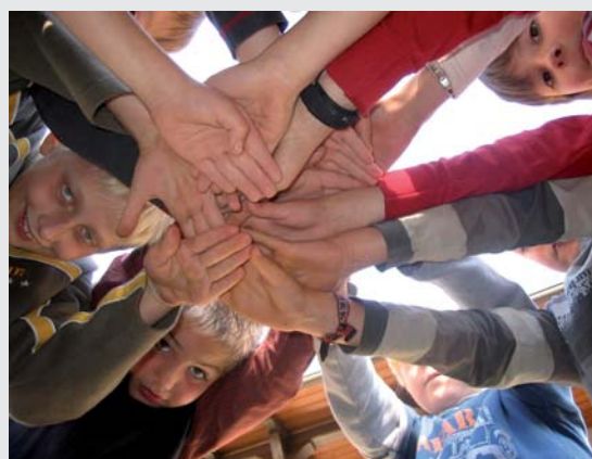
40 Jahre Helmstedter Chorknaben

Außerhalb der Proben treffen sich die Mitglieder des Chores und der inzwischen integrierten Musik- und Singschule zu den verschiedensten Aktivitäten. Das Spektrum reicht von Ausflügen, Radtouren, gemeinsamen Kochen und Backen, Computerspielen und Schwimmen bis hin zu gegenseitiger Hausaufgabenhil-