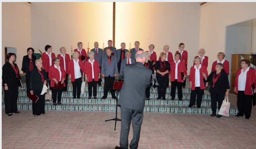
Der Fredenberg-Chor bei der Stellprobe zum Konzert in der Wilhadi-Kirche.

So stand für den ersten Tag ein Konzert zusammen mit dem Männerchor Gutenberg '62 in der Wilhadi-Kirche auf dem Plan. Geboten wurde ein abwechslungsreiches Programm. Schon das Eröffnungslied „Liebeslied für Lu“ vom Männerchor Gutenberg ließ erahnen, dass es ein wunderbares Konzert werden würde. Mit „Mann im Mond“ und „Alles nur geklaut“ von den Prinzen zeigten die Männer, dass modernste Musik sich als Chorliteratur eignet. Der Fredenberg-Chor ging dann zur klassischen Chorliteratur