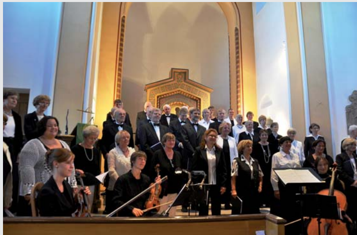
Der Oratorienchor Burgwedel in der St. Markus-Kirche nach erfolgreichem Konzert.

Mit dem von F. M. Bartholdy vertonten Gedicht von Joseph Eichendorff: „Abschied vom Walde“ brillierte der Chor genauso wie mit einem französischen Liebeslied. Die Zuhörer