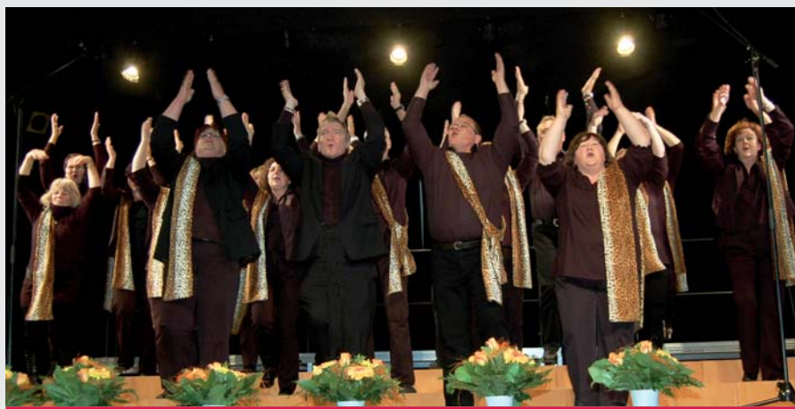
Singin' Friends Klein-Heidorn

Im Anschluss sprach Bürgermeister Dr. Hoppenstedt, der die Schirmherrschaft über das Konzert übernommen hatte, ein kurzes Grußwort, in dem er Sänger und Zuhörer in Burgwedel willkommen hieß. Er hob besonders