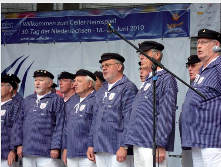
Mitschunkeln war bei den schwungvollen Liedern des Shantychores Helmstedt angesagt.

Der Tag der Niedersachsen ist für alle Chöre eine Abwechslung zu den sonst üblichen Konzerten – wann sonst hat man schon mal die Möglichkeit, sich auf einer großen Open-Air-Bühne mit professioneller Beschallung zu präsentieren? Wer beim nächsten Mal in Aurich vom 1. bis 3. Juli 2011 dabei sein möchte, sollte sich rechtzeitig beim Niedersächsischen Chorverband bewerben. Es stehen jeweils Zeiten am Samstag und Sonntag zur Verfügung. Pro Chor werden 20 Minuten Auftrittszeit zur Verfügung gestellt. gb